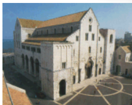
Pontificia Basilica San Nicola ore 16.00